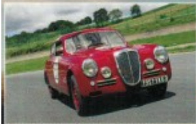
P. 26 LANCIA AURELIA B20 GT CLASSÉE... X !