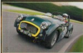
P. 56 TRIUMPH TR2 UNE CLASSIQUE POUR LE MANS