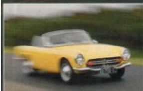
P. 32 1 000 KM EN HONDA S800